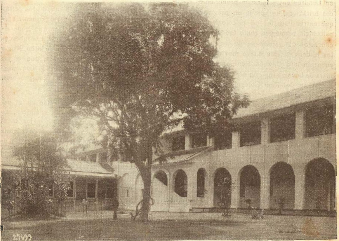
Hospital de San Juan de Dios.—Uno de los patios en el interior